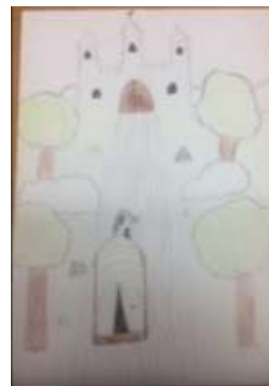
Ötödikese meseillusztrációi – 2022/2023. tanév

A 6. évfolyamon a tanórákon a roma népmesékről, balladákról, zenékről, a cigányság fontosabb íróiról, költőiről, zenészeiről tanulnak a gyerekek.