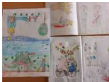
A 2022/2023. tanév során készített tanulói munkák – 1. évfolyam

A 2. és 3. osztályos tanulók életkori jellemzője, hogy szeretik a meséket, ezért ők is az eredetmondák segítségével ismerik meg a tantervi tartalmakat. A mesékhez illusztrációkat készítenek, azokat dramatizálják. A cigány szokások, hagyományok, művészetek megismerése is feladatuk. Használt taneszközeik: