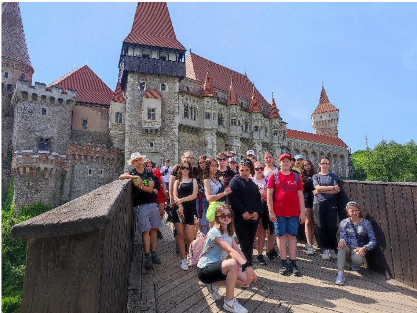
Déva várába felsétálva Kőműves Kelemen legendáját idéztük fel.