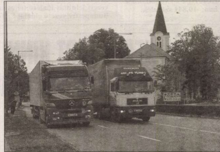
Naponta több száz kamion – köztük jó néhány veszélyes árut szállító – dübörög át a város főterén.

tasztrófavédelmet felügyelő Lampert Mónika belügy-, illetve Csillag István gazdasági és közlekedési miniszterhez, kérve segítségüket a várost – s ezzel együtt az ugyancsak potenciáli-