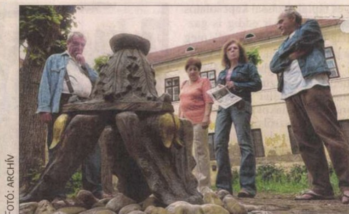
A kanizsai hitközség vezetői júniusban, a menóra hűlt helyénél