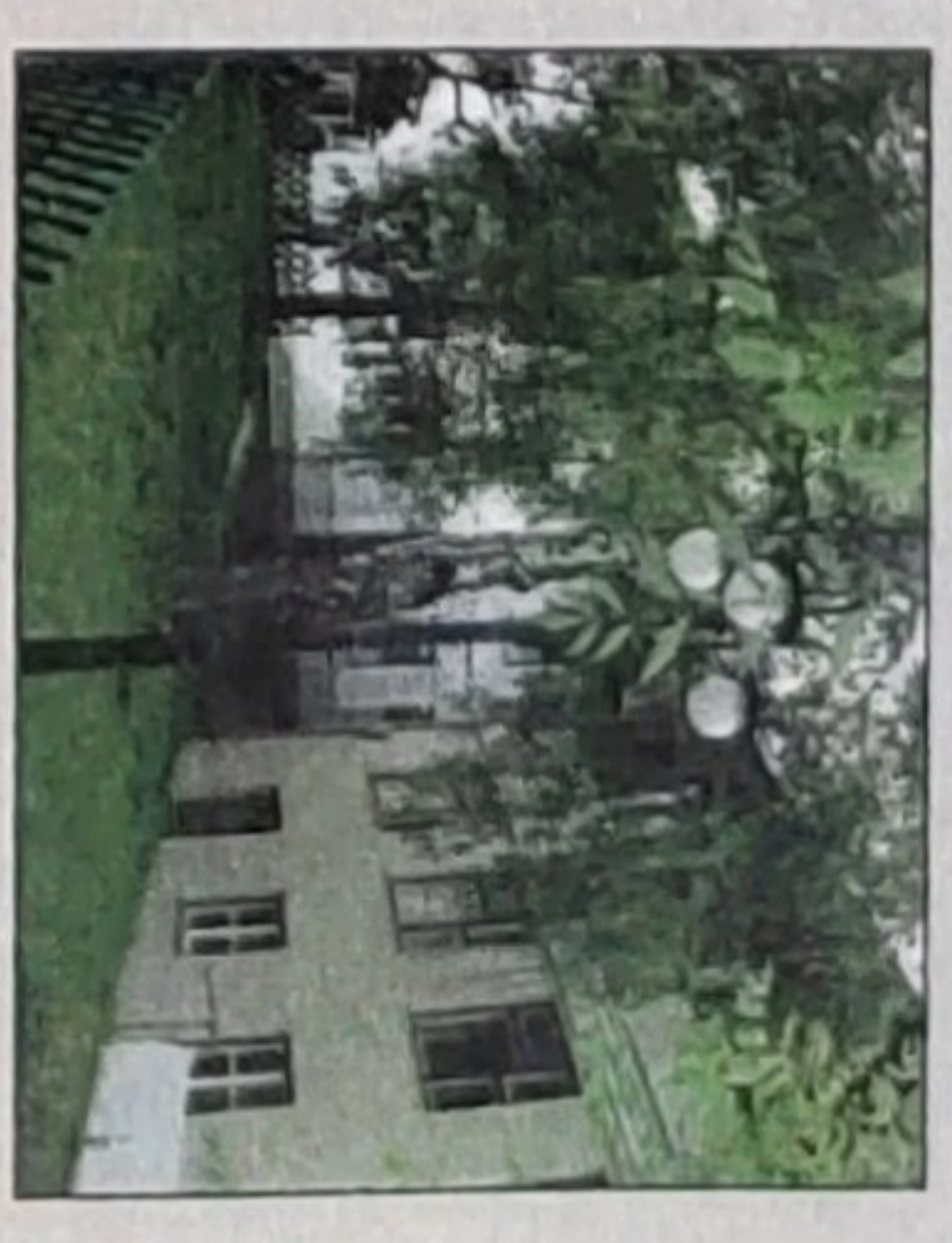
Iskolánk egyik melléképülete

Alapvető kötelezettségünknek érezzük az emberiség egyetemes, sok ezer éves, kiértelt értékeinek bemutatását. Egyik oldalon a rend, a