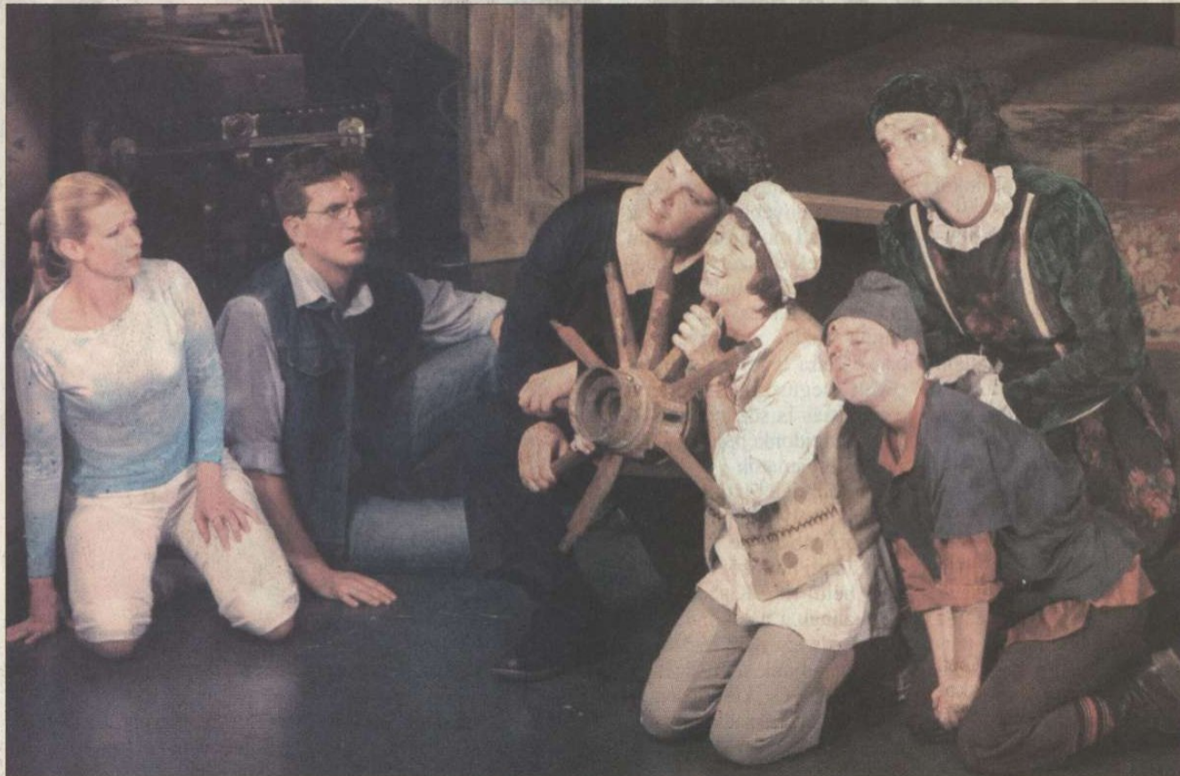
Öt éves jubileumát ünnepelte ezzel a pergő zenés előadással a Balaton Színház. Felvételünkön a teljes „Padlás-lakosság” látható

Az elfeledett mesehősök, akik a budapesti padláson rekedtek, mindenáron szeretnének eljutni arra helyre, ahol örökké emlékezni fognak rájuk. Lehetőségük is adódik erre, amikor a padláson megjelenik a Révész, aki az ég és föld közötti helyről átsegíti őket a csillagok közé. Az már csak bonyolítja a helyzetet,