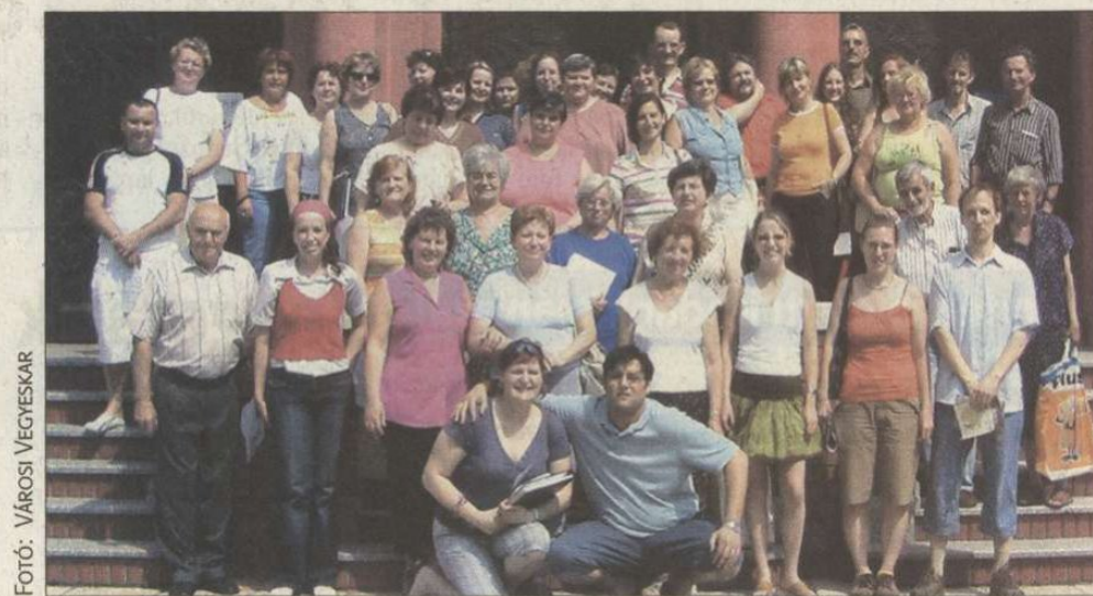
A Városi Hangversenyterem előtt a régi tagokkal is próbáló vegyeskarról készült a felvétel

Fennállásuk ötven éves évfordulójára koncerttel készülnek