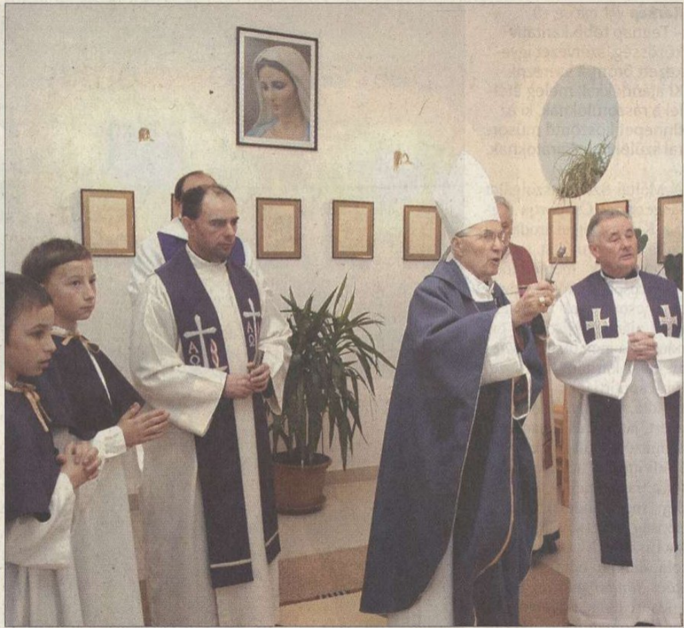
Gyűrű Géza érseki helynök szenteli fel a csapi iskolában létrehozott Bosco Szent János-kápolnát

nem lesznek vallási iskola, nem kényszerítenek senkit, de mindenkinek meg akarják adni a lehetőséget a vallása gyakorlására. Annak nevelő erejétől ugyanis azt remélik, hogy a mindennapos pedagógiai munkában is segítségükre lesz. Gyakorlatukban ugyanis volt már