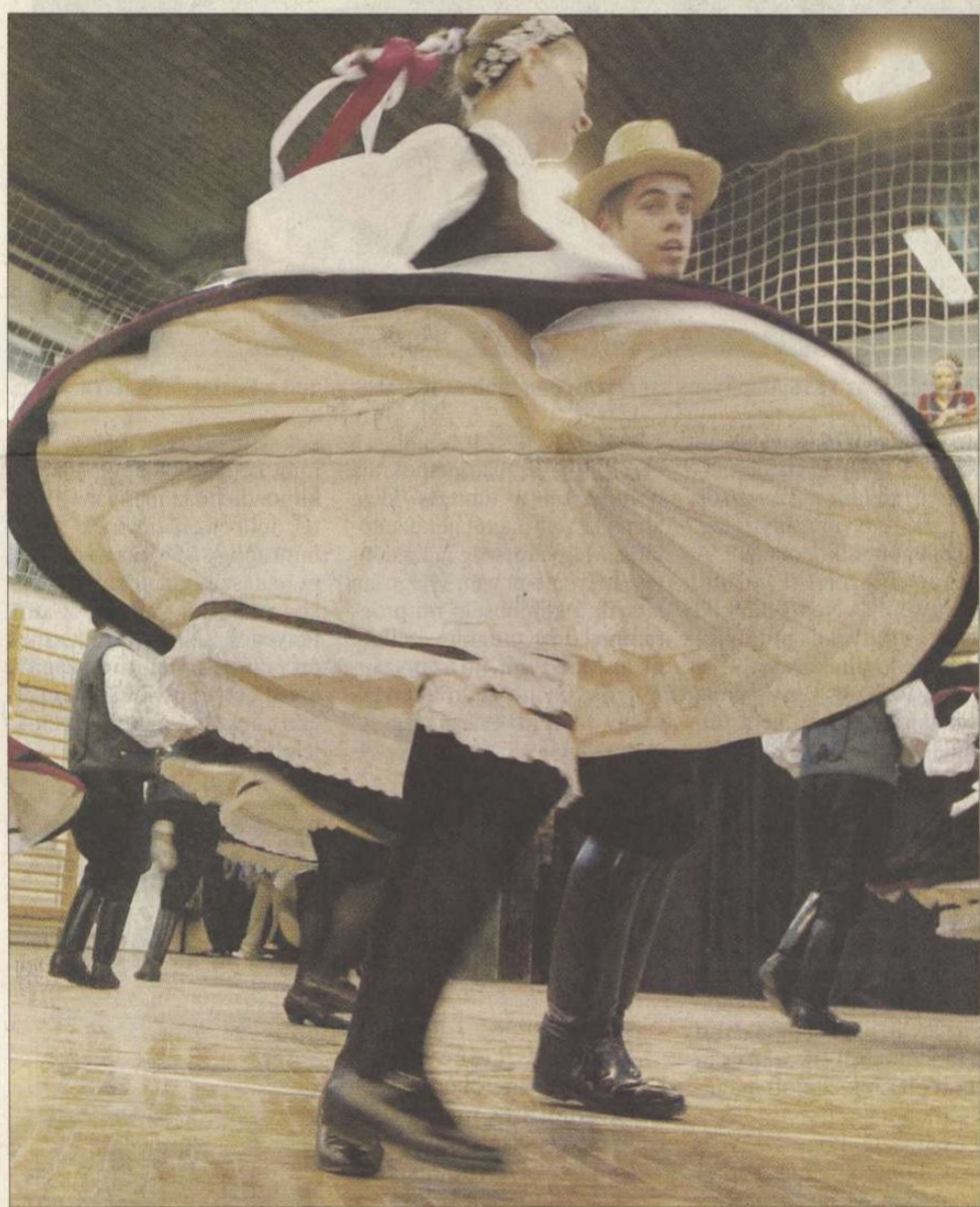
A Kanizsa Táncgyűttes táncosai a csapi iskola színpadán, ahol a Kanizsa környéki kistérség művészeti együttese mutatkozott be. Akarnak és tudnak saját teljesítményükkel értéket létrehozni