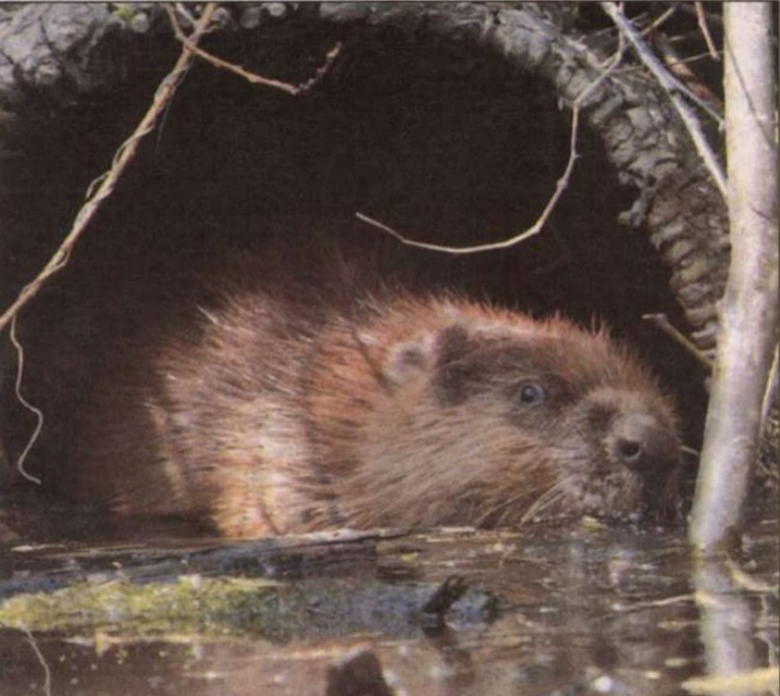
Szécsisziget (v. a.) – A falu környéke – úgy is, mint a Kerka-mente Natúrpark egy darabja – gazdag természeti értékekben, az utóbbi években a fotón látható hód fajtársai is visszaköltöztek ide. (A természeti értékekről részletesen az 5. oldalon írunk.)