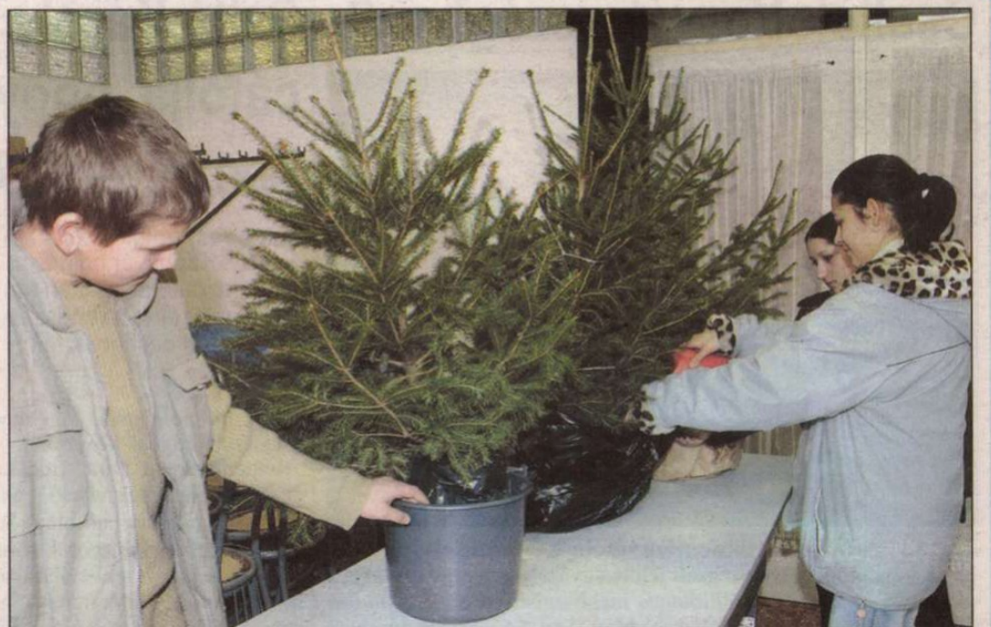
Az Apáczai ÁMK-ban a tavaszi kiültetésig a diákok gondozzák a gyökeres fákat

Az egerszegi Apáczai ÁMK második alkalommal döntött az élő fenyők árusítása mellett. A hatvan fából a karácsony előtti napokban maradt ugyan néhány, ám azokat felajánlotta az intézmény a pózvai idők otthonának. (Folytatás Tovább nevelik címmel a 4. oldalon.)