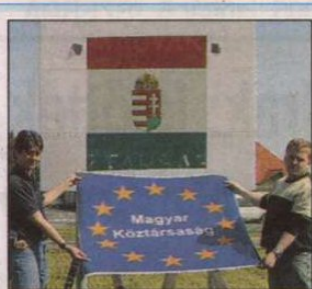
Az elmúlt év zalai eseménycsoportjának (I. rész) a 10. oldalán.