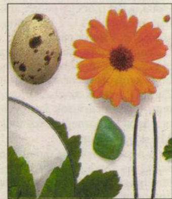
A természet feltárja titkait, ha közel hajolunk hozzá

A letenyei általános iskola 4. B osztályának tanulói biztosan nem hallottak otthon efféle riogatást, hiszen nagy kedvet éreztek, hogy bekapcsolódjanak a Barátunk, a természet című, országos levelezős játék feladatainak megoldásába. Tették olyan sikerrel, hogy