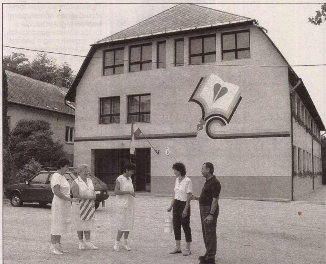
Tanterembővítésre vár a zalaszentbalázi általános iskola épülete is