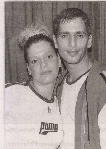
McDucky és Herbie

előadásról is, melyet Nyilassy Judit érdemes művész rendezett szülővárosának, Vasvárnak városközeli „Szentkút” nevezetű történelmi búcsújáró zárandokhelyén, nem kevés nehézség közepette. Az Életünk műmellékletében a Textil Múzeum kiállításának alkotásai láthatók, Jacquard témában, melyről bővebben a folyóiratban szintén olvashatunk.