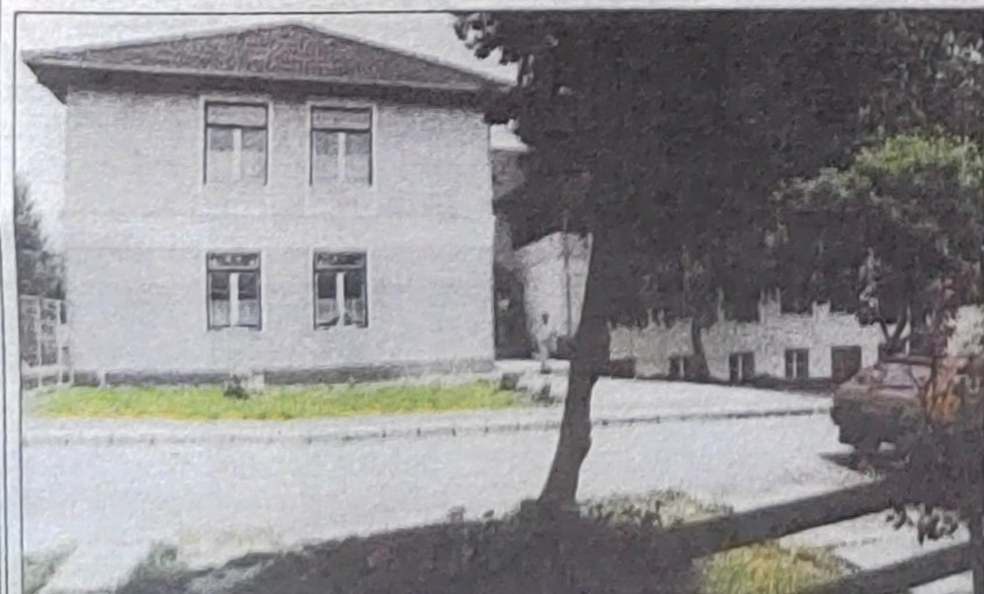
Ez az újabb díj a falu kollégiumban.

A település életében fordulatot jelentett 1973, amikor megnyílt a hátrá-