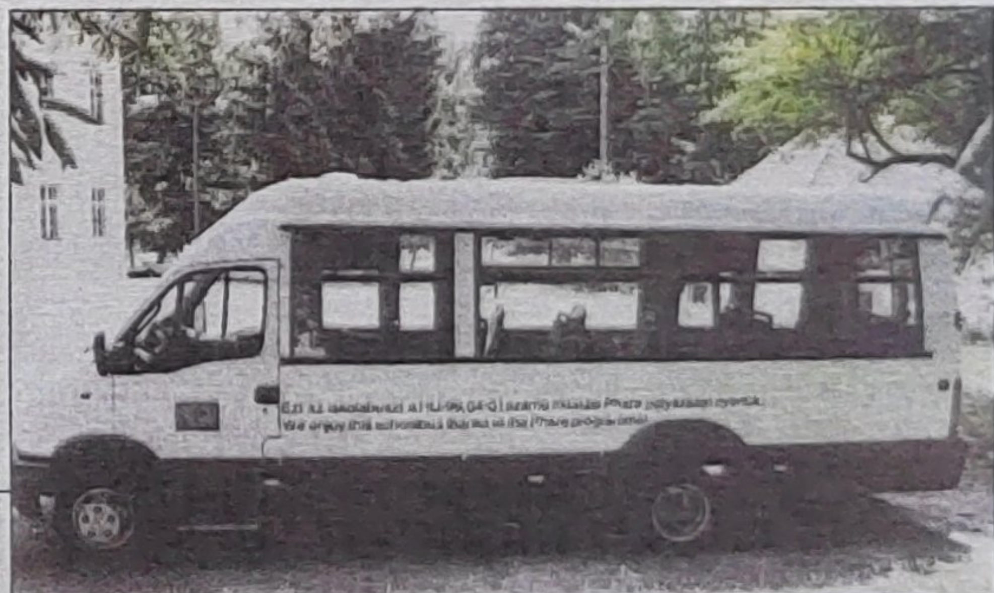
Megérkezett az új iskolabusz.

Az önkormányzat forrást szerzett a számítógépes eszközpark korszerűsítésére, a közelmúltban pedig két szociális bérlakás építésére nyert 14,7 millió forintot a Széchenyi-tervből. A polgár-