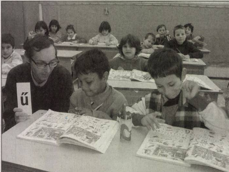
Somogyi gyerekek is járnak a csapi iskolába

- Amikor bekerülnek hozzánk a gyerekek, meg kell tanítani őket az alapvető tisztálkodási és étkezési szokásokra - mondta az igazgató. - Délutánonként pedagógusok segítenek nekik, így készülnek föl a másnapi órákra. Ezt a szülei - mivel többnyire csak néhány osztályt végeztek - nem tudnák nekik biztosítani. Tízegynéhány ser-