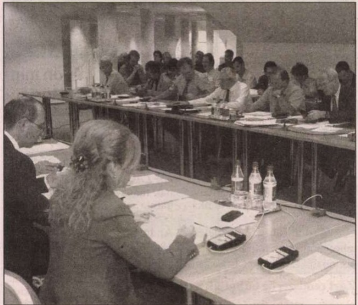
Új helyen, a könyvtár elegáns fogadótermében tanácskoztak

hogy bárkit köteleztek volna aláírása visszavonására, mint mondta a két érintett képviselő időközben belátta, hogy az akció csak politikai hangulatkeltés, ezért húzták ki a nevüket a listáról. A Fidesz szerint az lenne a