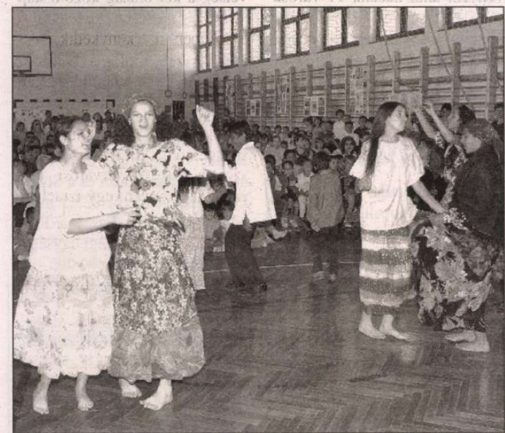
A csapi iskolások a cigányság történetét dolgozták fel