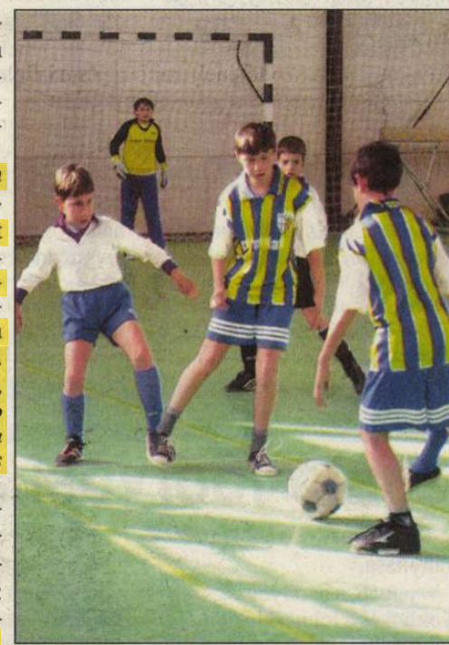
Szeretik a focit...