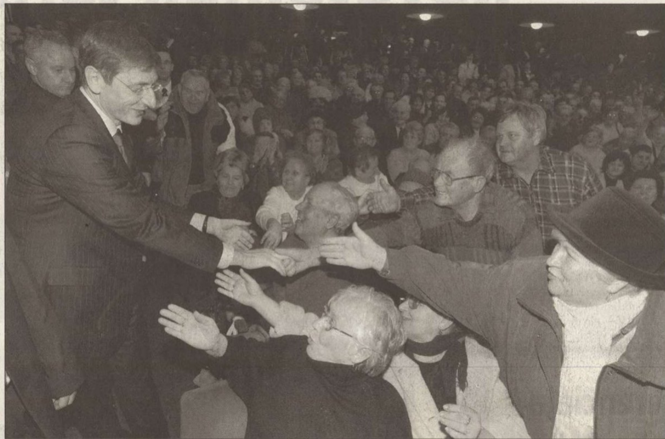
A miniszterelnököt nagy szeretettel fogadták a fórum résztvevői. Az okos és bátor, progresszív kompromisszumokban bízunk – mondta