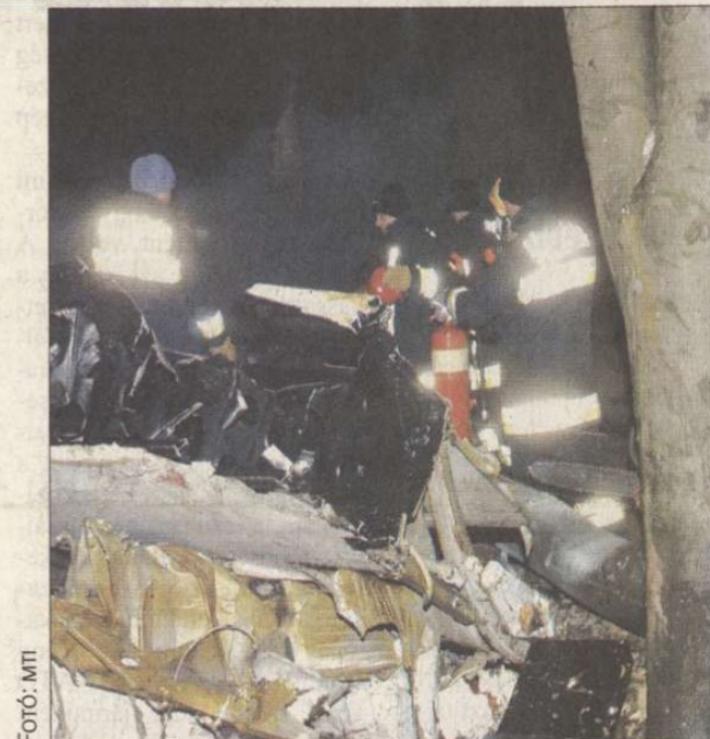
A mentőalakulatok tagjai áldozatok után kutatnak a katasztrófa helyszínén a Borsod megyei Hejce mellett, ahol egy szlovák katonai szállító repülőgép zuhant le január 19-én este

Budapest (mti) – Negyvenkét halottja és egyetlen túlélője van a szlovák katonai repülőgép katasztrófájának, amely csütörtökön az esti órákban történt a Borsod-Abaúj-Zemplén megyei Hejce község közelében.