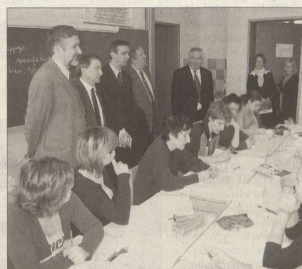
A parlamenti delegáció tagjai a lendvai kétnyelvű gimnáziumban

– A legfontosabb, hogy a magyar-szlovén kapcsolatokat 2006 ne a megállás éve legyen – utalt a választásokra a képviselő. – Folyamatos aktivitásra van szükség, e látogatással talán sikerült egy olyan