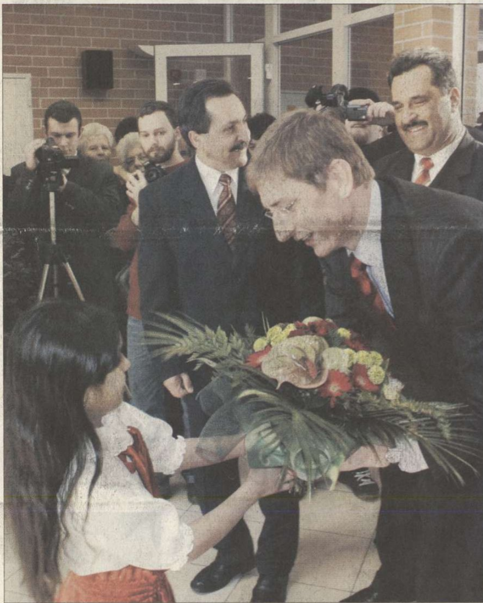
Gyurcsány Ferenc a csapi iskolában. A cél az, hogy a gyerekek a szüleiknél, nagyszüleiknél könnyebb, kiszámíthatóbb, nyugodtabb világban élhessenek, mondta az avatási ünnepségen

SMS-számunk: ZV 06-90-631-300 Üzenetét ZV (szóköz) jellel kezdje!