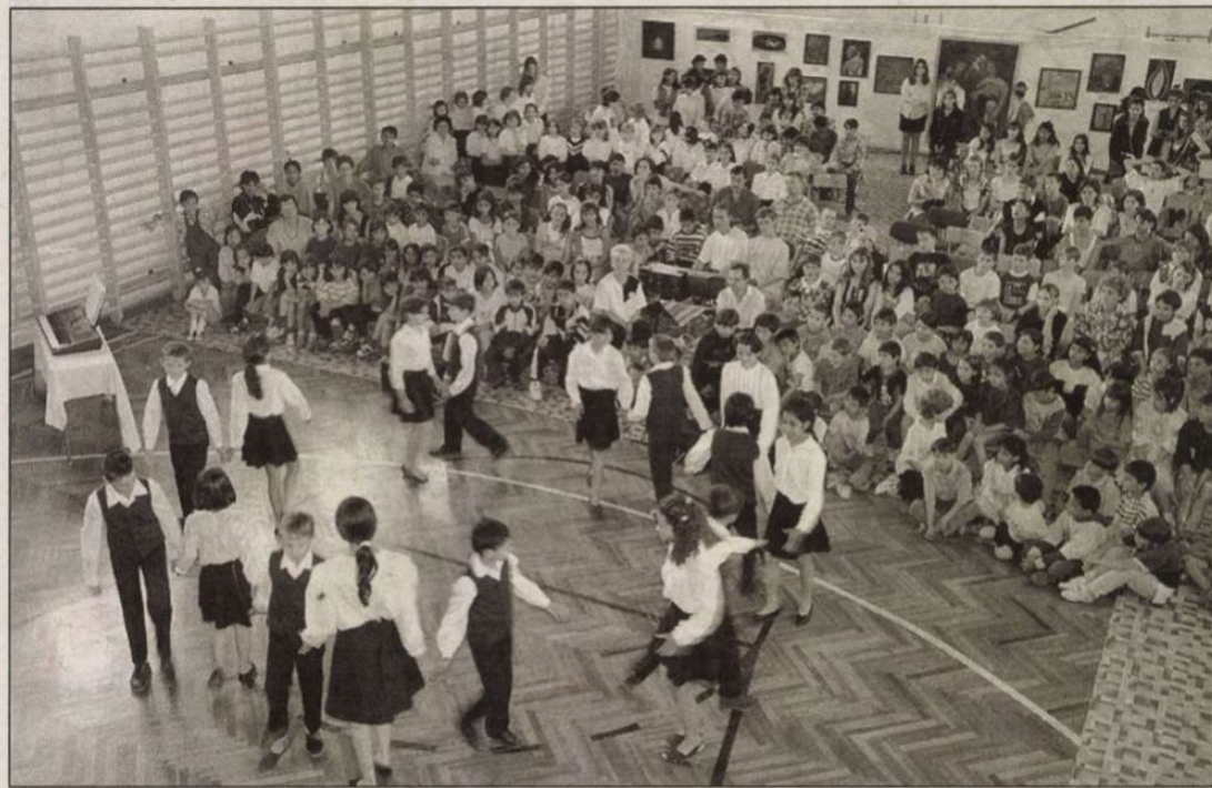
Több száz iskolás gyermek vidám seregszemléje

Tolerancia nap — negyedszer a csapi diákokthozban