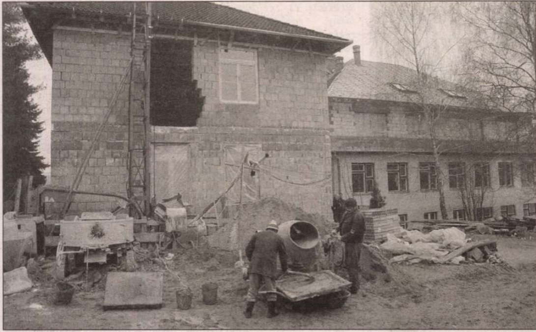
A bővítéssel új lehetőségek nyílnak meg az iskola előtt