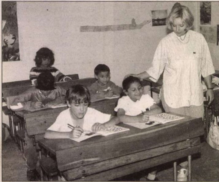
Szentpéterúron okosan kamatoztatják a kiegészítő támogatást.

Az óvodából kikerült, ám még nem iskolaérett gyermekek Szentpéterúron tudniillik előkészítő osztályba járnak. Mint megtudtuk, erre azért van szükség, hogy a tanulókat ne kudar- — vérsé —