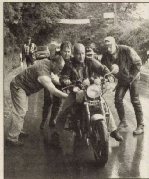
Konzílium... Van úgy, hogy a szupergép amit művelünk sem indul.

— Csak polgárpukkasztás, tartalommal nem töltjük meg — hangzott a válasz. — Az embe-