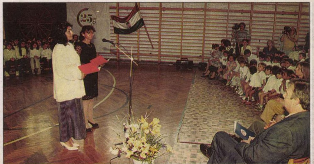
A jubileumi ünnepség számos érdeklődőt, segítőt, családtagot vonzott.

(Tudósításunk — A boldogulás igazi útja címmel — a lap 4. oldalán folytatódik.)