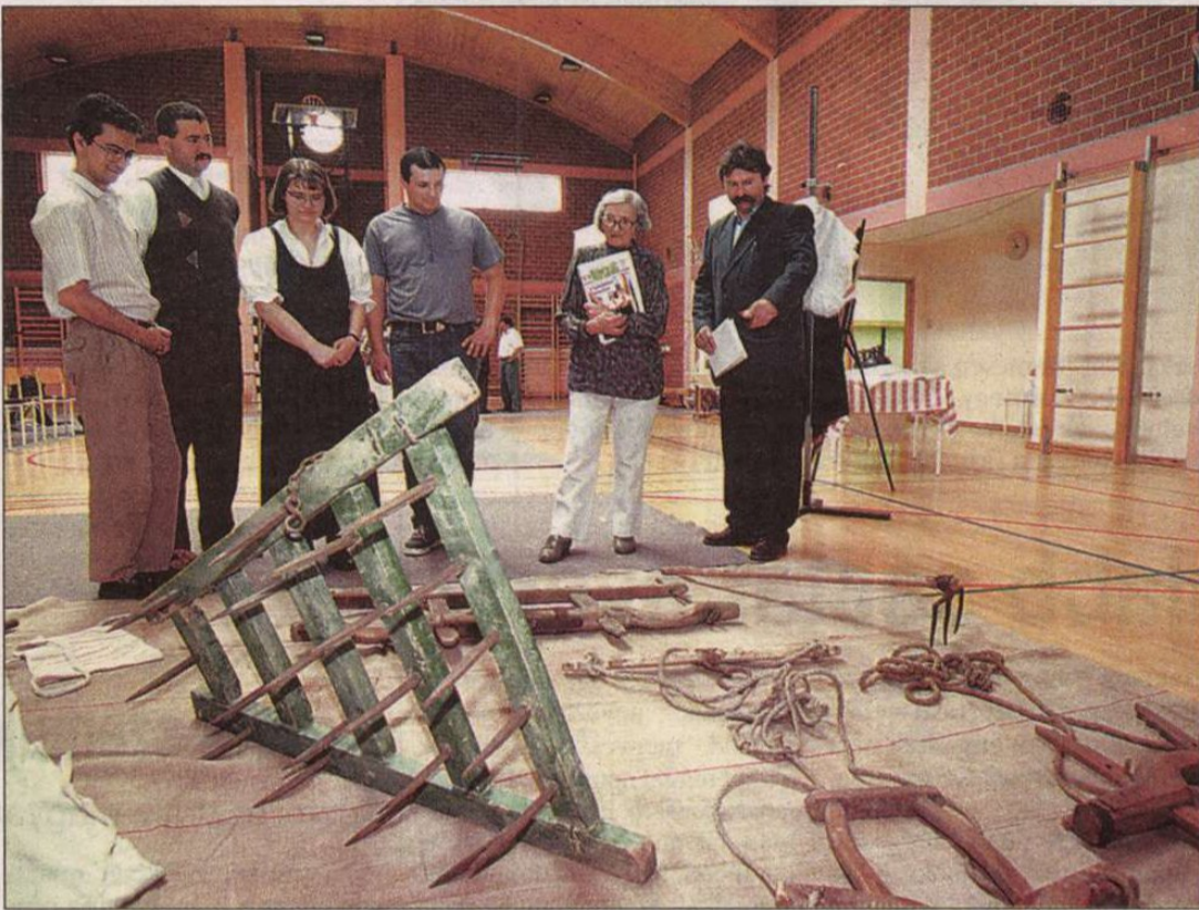
A Hetés néprajzi értékeiből rögtönzött tárlat több darabja Budapesten is látható lesz a nyáron.

Tanácskozás Göntérházán Hetés néprajzi értékeiről