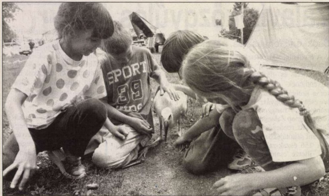
A vidornyaszőlősi táborban a természettel ismerkedtek a gyerekek.