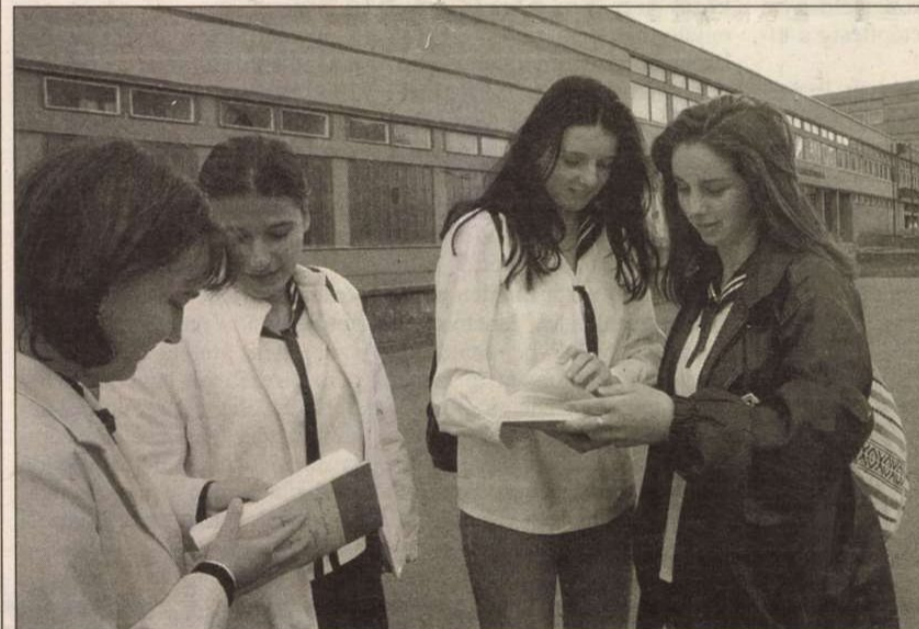
A dolgozatírás után a zalaegerszegi Deák szakközépiskola végzősei.

— Az általánosabb, több költőt és verset felölelő lírai témakört választottam — mondta. — Az izgalmak közepette a kiválasztás elég nehéz volt, alaposan átgondoltam, hogy mely feladattal kapcsolatosan rendelkezem a legtöbb ismerettel. A kezdésnél voltak bizonytalanságaim, de úgy érzem, végül is sikerült jól összeszednem a gondolataimat.