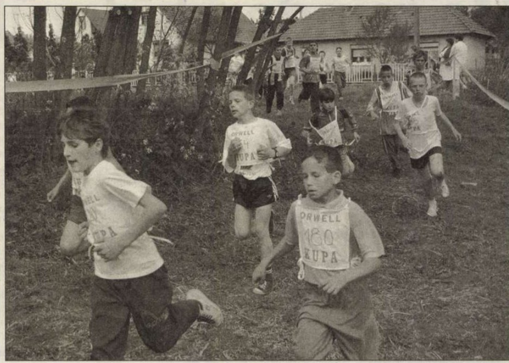
A Csapi Általános Iskola és Diákotthon fennállásának 25. évfordulója tiszteletére rendezett ORVELL-Csapi Maratonka futóversenyen 24 iskola közel 700 tanulója vett részt.