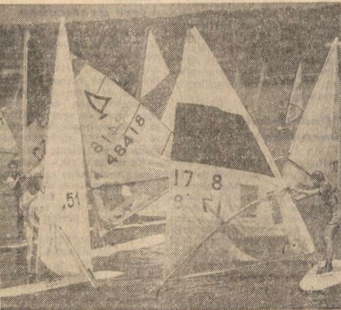
A Velencei-tavon a napokban nemzetközi szilvasversenyt rendeztek. A hazánkban is gyorsan terjedő kedvtelés-képviselei közül csaknem százan álltak vízre.

— Jól jön a pénz nyárra, s a munkát is jobban szeretném megismerni. Jövőre végzek az iskolában és itt akarok elhe-lyezkedni. M. H.