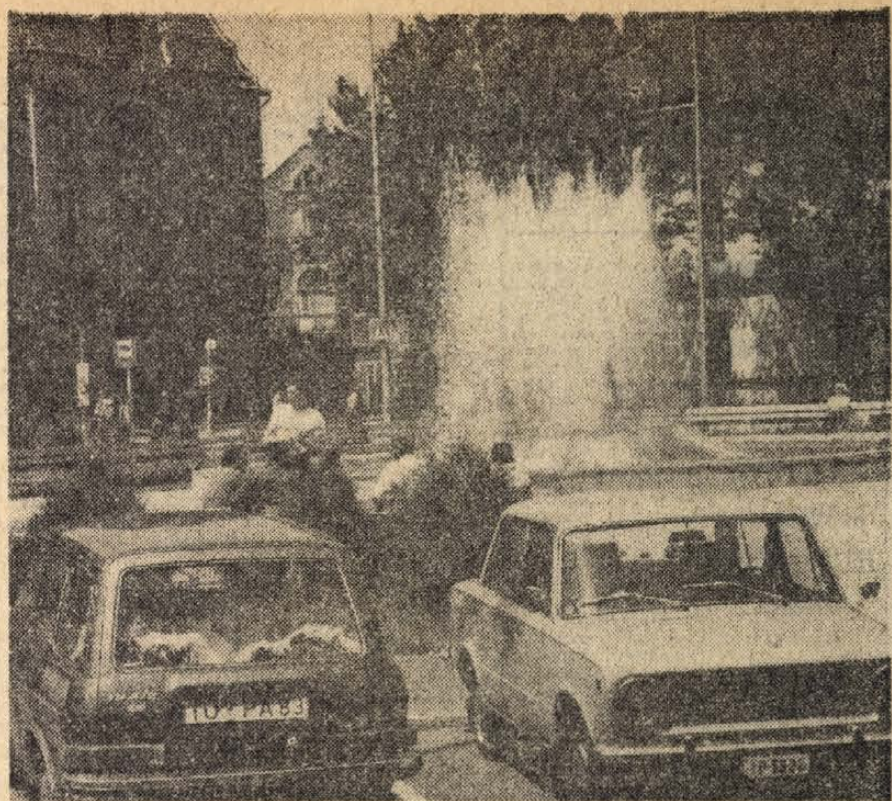
Szeged egyik legforgalmasabb útvonalánál, a József Attila sugárút belvárosba torkolló szakaszán új szökőkútát építettek. A Hungária Szálló előtti „vizeses” kellemes látványt nyújt és jól díszíti a környezetet