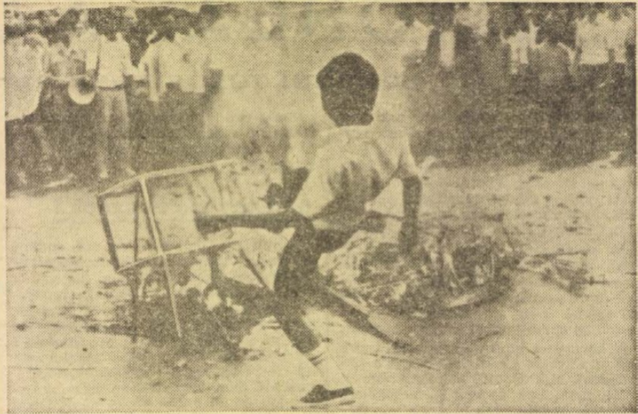
A hét szerdáján thaiföldi diákok tüntetéseket rendeztek, a japán gazdasági imperializmus szimbólumait, televízió-, rádiókészülékeket, japán gépkocsik papírmáséból készült másolatát égették el Bangkokban. A szerdai tüntetés egyúttal Tanaka miniszterelnök kétnapos thaiföldi látogatásának is szólt.

A héten egyébként az egyiptomi belpolitikai élet is megélenkült. Szadat egyiptomi elnök Hegazi miniszterelnök-helyettes, pénzügy-, gazdasági és külkereskedelmi minisztert bízta meg a következő időszak stratégiájának kidolgozásával és a tervbe vett kormányátalakítás kérdéseinek tanulmányozásával. A tárgyalások sikerébe vetett egyiptomi