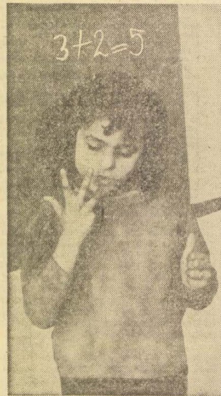
Nem könnyű az ujjakkal is megmutatni, hogy 3+2=5 .

Ha ma az ember végigmegy az épületen, beszél néhány szót fiatal lakóival, nézi viselkedésüket, az értük érzett felelősség hatása alól — látva e fogékony korban levő gyerekek rendkívül gyors változását, alkalmazkodását — csak még nehezebben szabadul. Részletezzük e változást? Legfeljebb ilyeneket tudunk felsorolni: reggel-este fogat mosnak, késsel és villával esznek, köszönnek, lá-