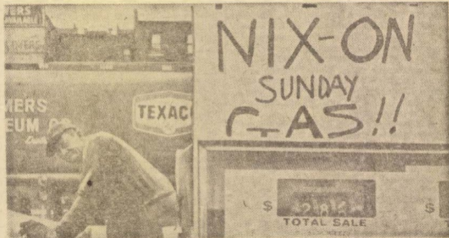
„Vasárnap nem árulunk benzint!” — az egyik amerikai benzinkút tulajdonosának szellemes szójátéka Nixon nevével.

A tőkésországok kormányzatai, hátuk mögött a nagy monopóliumokkal, most egymás közti megegyezésre törekvésnek, hogy a munkásmozgalom eddigi vívmányainak megsemmisítésével, a szakszervezetek, a bérharcok megtörésével fokozzák a kiszáradást. Ebben a helyzetben tehát rendkívül időszerű az esseni felhívás: akcióegységgel szállni szembe a munkásság, a külföldi munkások érdekei ellen fellépő nemzetközi tőkével.