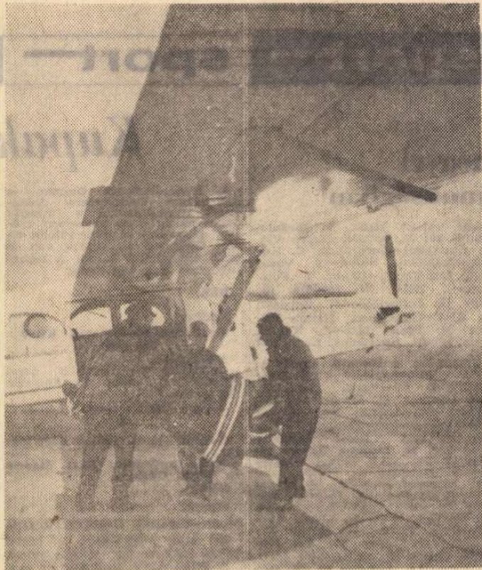
Ebben az évben ünnepli megalakulásának negyedszázados jubileumát az Országos Mentőszolgálat. Az állandóan fejlődő és gyorsuló betegszállítás egyik fontos segédkezése a „PILATUS PORTER” típusú turbólégsaváros mentőrepülőgép. A képen: súlyos beteggel érkeznek a mentők a budai repülőtérré.