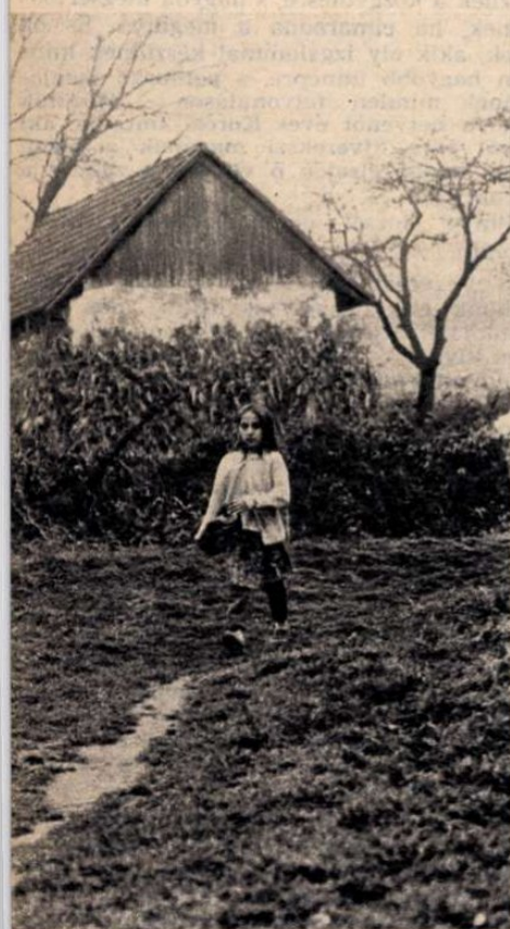
Hazafelé az iskolából a faluszéltre