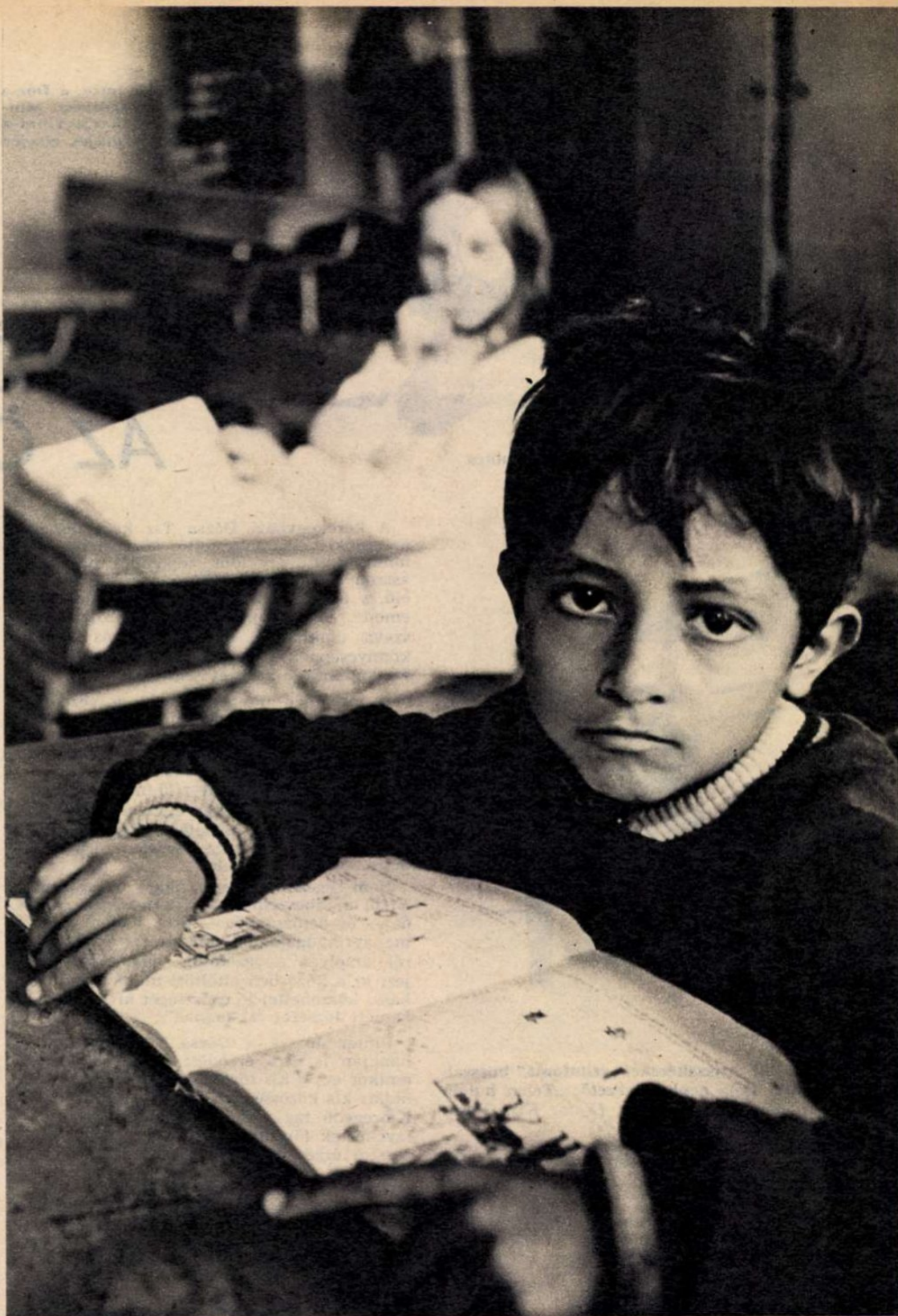
A hátrányos helyzetűek között is a leghátrányosabb helyzetben a cigánygyerekek vannak

a tanulás jól feltételeit megteremteni a szocialista humanizmus parancsa.