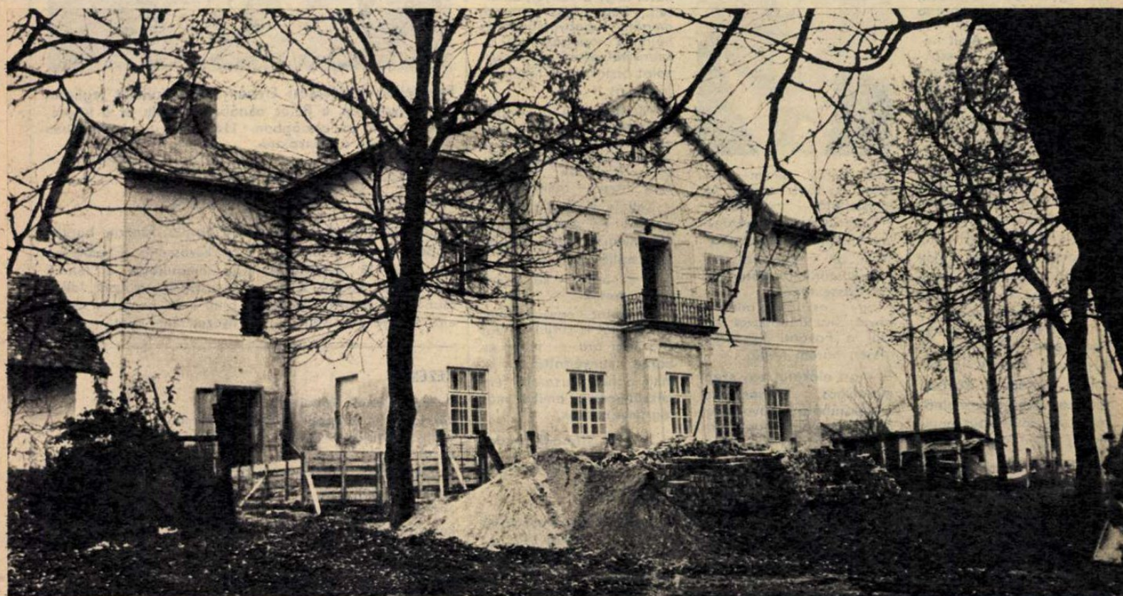
A jövő nyártól elkezdődik a kastély új, eddig legérdekesebb története