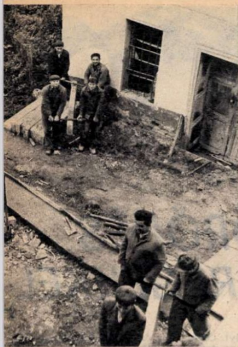
Zalakovári munkások építik a cigánykollégiumot