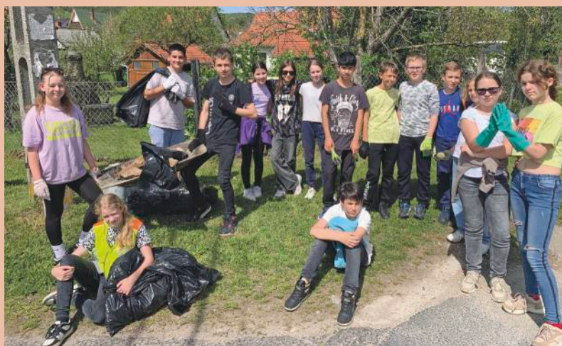
A 6. o. is eredményesen dolgozott

Iskolánkban megrendezésre került egy újabb projekt nap. Már reggel kaptak a diákok egy feladatot, méghozzá azt, hogy az iskolába környezetbarát járművel jöjjenek annak érdekében, hogy ne szennyezzék a levegőt. Ezt a feladatot a 8. osztály nyerte meg.