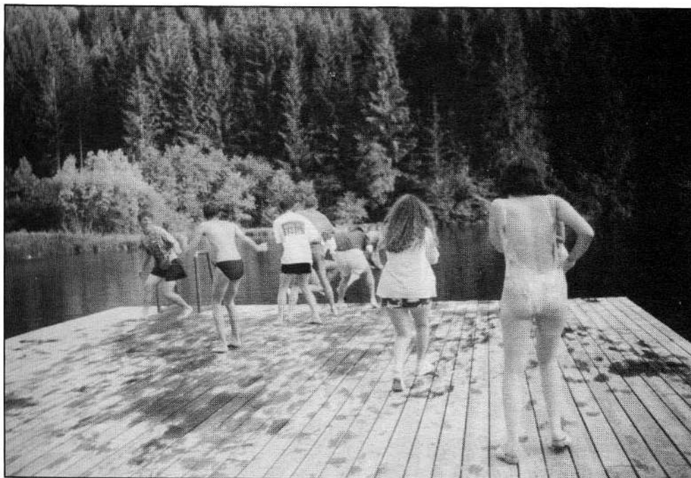
Vízitábor Ausztriában 1998-ban