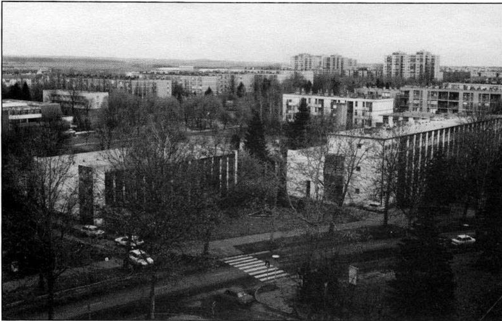
Az iskola madártávlatból