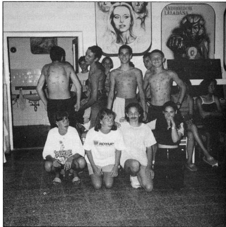
Játékos vetélkedőn a balatonmáriafürdői gólyatáborban