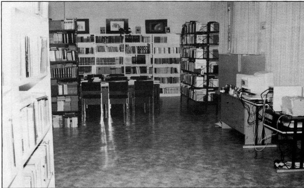
Az új iskolakönyvtár olvasóterme

Örömmel fogadjuk mindig a visszatérőket. Az ő névsoruk nem szorítkozik az utolsó 5 évre.