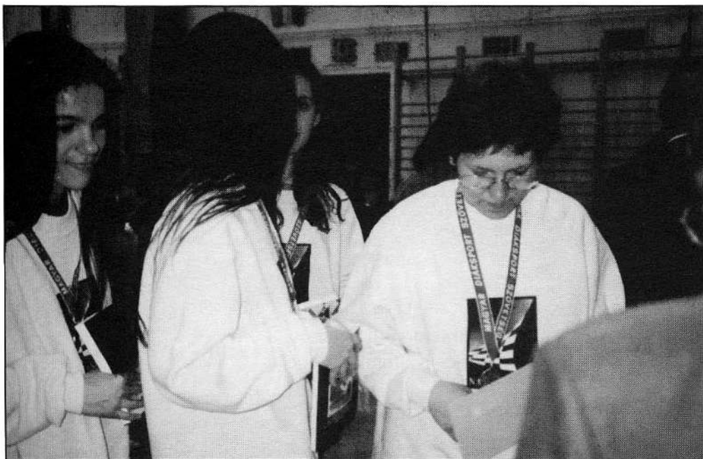
A 3. helyezést szerzett csapat az Országos Sakkolimpián 1995/96-ban