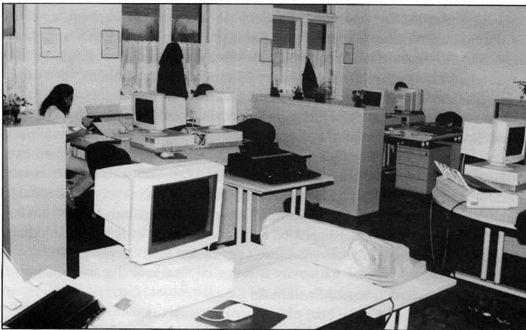
Az iskolánk új gyakorlóirodája, ahol szimulálni lehet a vállalatok komplett tevékenységét

Nagyot fejlődött a számítástechnikai gépparkunk. 1994-ben 2 PC-s és 1 Machintosh számítógéptermink volt, jelenleg 3 PC-s és 2 Machintosh gépekkel felszerelt teremben folyik számítástechnikai, informatikai, gépiró, szövegszerkesztő oktatás. Sikeresen szerepeltünk a SuliNet pályázaton, így 1998-ban kiépülhetett az internethálózat is, amelyen ma már nem csak a tanárok, hanem a diákok is dolgozhatnak.