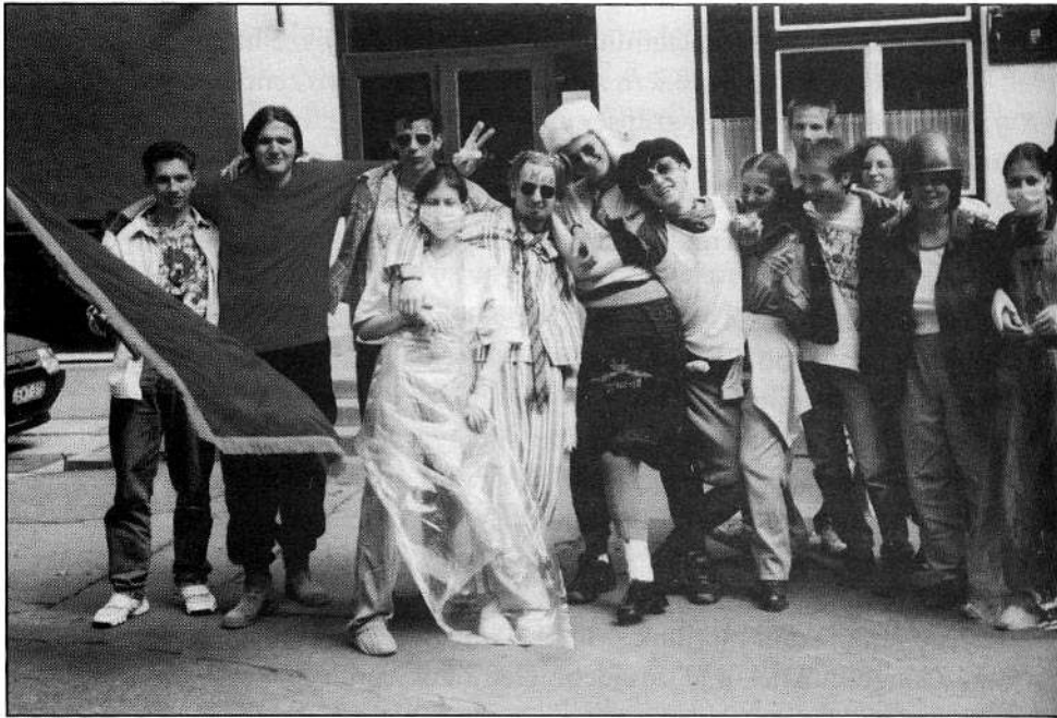
Iskolai „bolondnap”, a 4. évfolyam tréfás búcsúzója