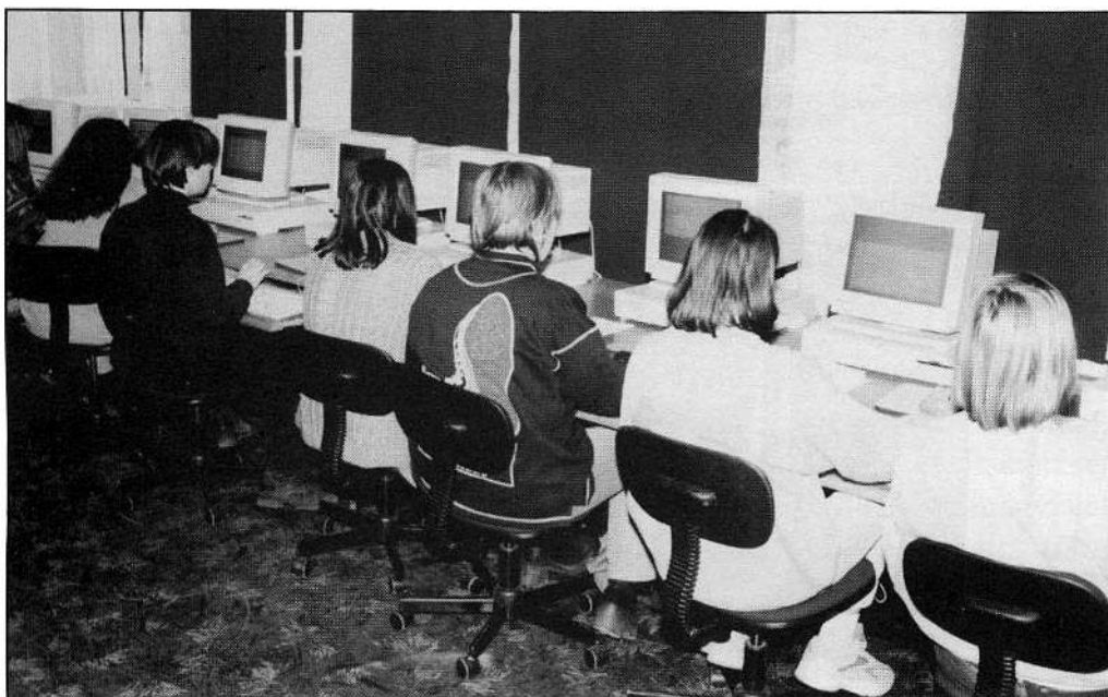
Iskolánk internetes terme

1997-ben alakítottuk ki a hamarosan közkedvelté vált közismereti előadót.