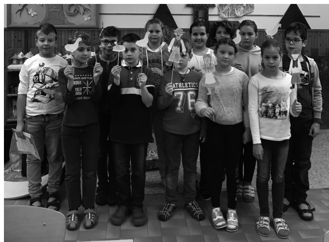
Az alsósok projekthetén a liba volt a téma

Valószínűleg a legtöbb tanuló sok új információt szerzett ezeken az órákon, és a megszokottól eltérő módon, nem tankönyvből tanulva, hanem tapasztalatok által.