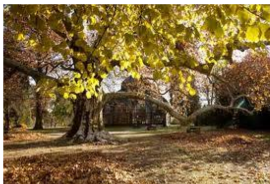
Szabó Barnabás 5.a