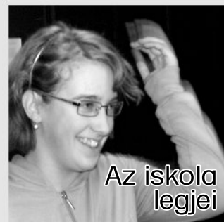
Az iskola legjei